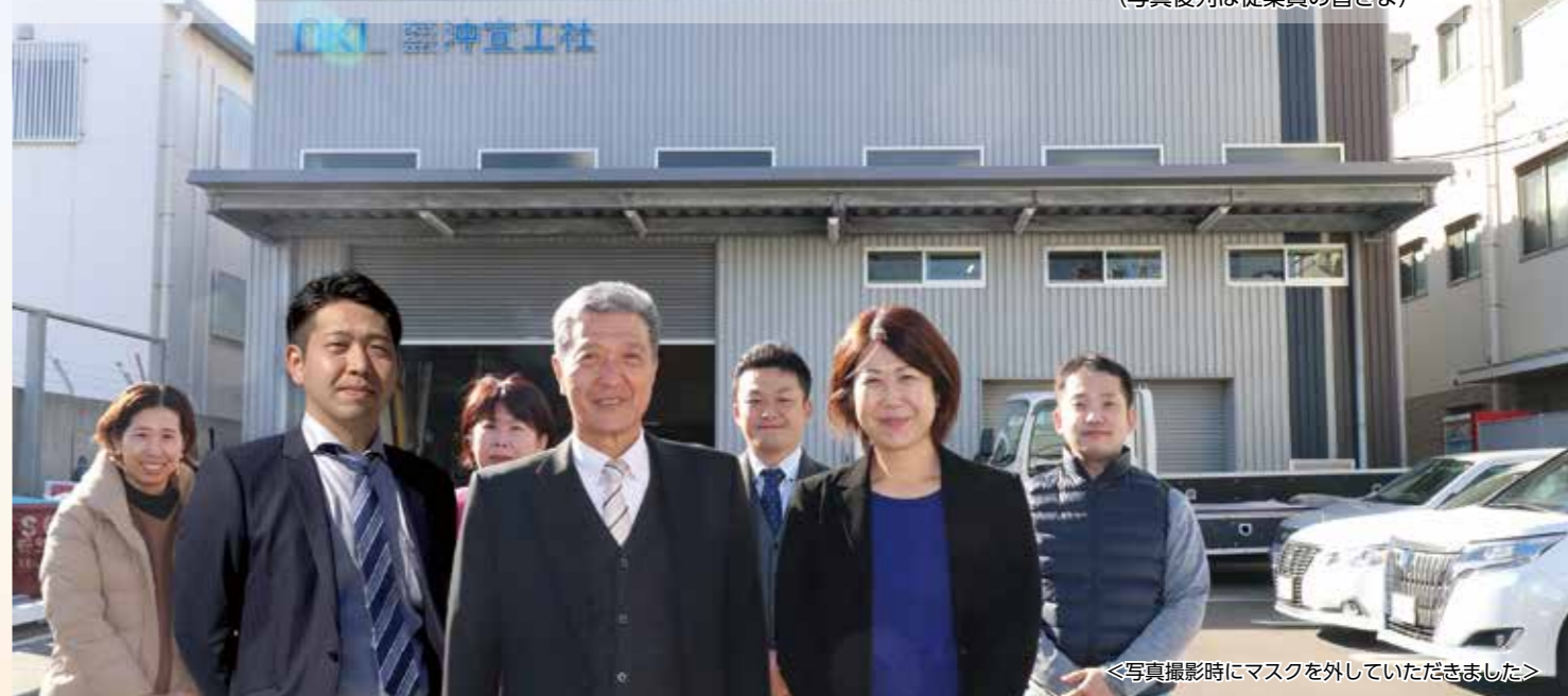
<写真撮影時にマスクを外していただきました>