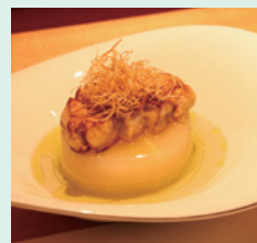
「フォアグラ大根」。和と西洋が融合した代表作とも言える一皿

シェフが自ら選び抜いた薩摩焼や有田焼などの美しい器にも注目。味覚だけでなく、視覚にも語りかける料理をぜひ堪能して。