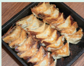
熟成豚餃子7個420円(掲載写真は3人前)。自家栽培の無臭にんにくで食べやすい

自家製の辛みそにつけると更に旨味がUP!あつあつの餃子を白ワインと一緒にどうぞ!