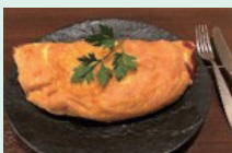
「季節の野菜のふんわりオムレツ」

☎ 099-257-8355 所 鹿児島市中央町24-15 1F 時 ランチ11:30~15:00 デイナー18:00~3:00 休 ランチ:水曜日 デイナー:火曜日 P 無 Web Facebook、LINE