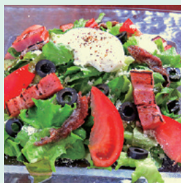
「ペペールのサラダ」。完全無農薬で栽培した野菜を使用

コースは4,000円からご用意(予約制)。メニューは随時リニューアルされ、「ちょこっと食べるメニュー」など単品メニューも充実。気軽にフランス料理をお楽しみあれ!