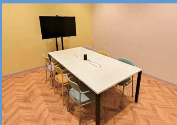
▲会議室は2部屋。それぞれの部屋にはSATSUMA、SAKURAJIMAとユニークなネーミング