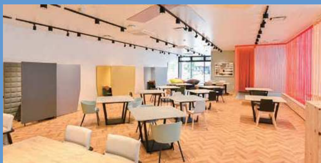
◀明るく広々としたコ・ワーキングスペース。集中ブースも3席完備

令和4年4月11日、天文館に新たなコ・ワーキングスペース「HITTOBE Powered by The Company」が誕生しました! 鹿児島銀行を中心に企画されたイノベーションプロジェクトで、鹿児島銀行・PBOOKMARK・Zero-TenPark・GMOペパボの4社が連携し、コ・ワーキングスペースだけでなく地元企業のサポートを通して、鹿児島がもっと活性化し飛躍する場所になることを目指し、開設されました。